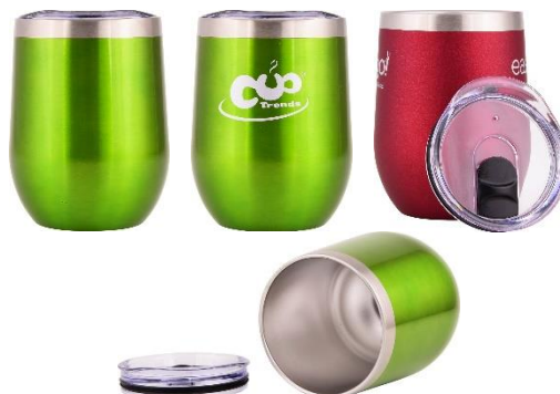
(Abbildungen sind Produkt-Beispiele)

Becherfarben: Auswahl aus 17 Standardfarben* oder nach Pantone (3.000 Becher je Farbe) Farbbeschichtung wählbar als „glänzend“ oder „matt metallic“