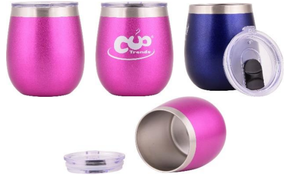
(Abbildungen sind Produkt-Beispiele)